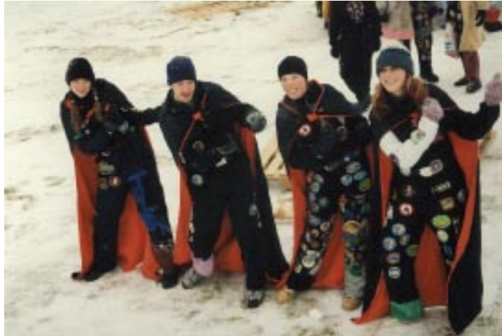
▲ Faust charmade piraya efter piraya med iskallt koreograferad dans.