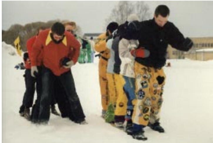
▲ Parallellslalom med Coraxz och Uppsala-laget Tuff FUTF Tupp.