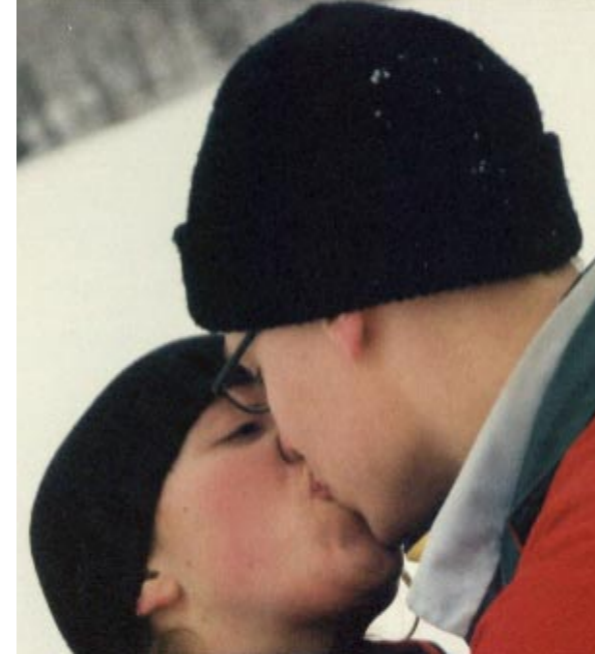
▼ Att hålla värmen under OS, lektion 1