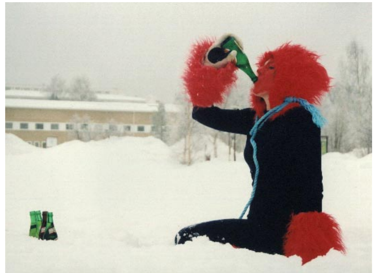
▲ Monsterflicka som vet hur en flaska ska tömmas