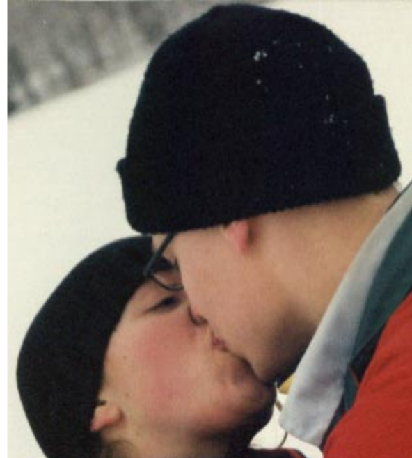
▼ Att hålla värmen under OS, lektion 1