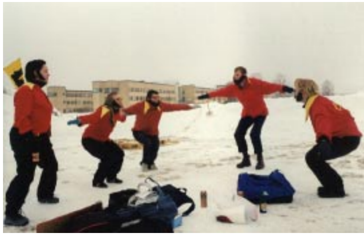
▲ Det är särdeles viktigt att värma upp ordentligt. Dansbandshjälarna i Coraxz missade inte en enda muskel och fick övriga deltagare att både dansa styrdans och dra på smilbanden.

Efter mycket längtan, en del ångest och desto mer förväntan var det så dax: Otympliga Spelen anno 2003. Om du missade något, eller om minnet ditt sviker, ger Tsur dig en tillbakablick på årets mest otympliga händelse.