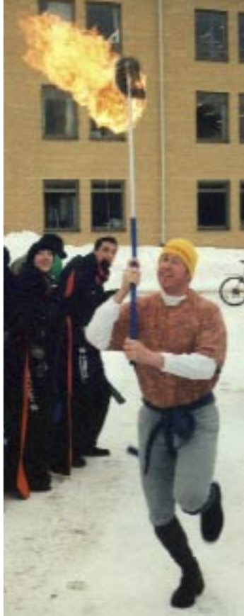
▼ Sprungit långt...