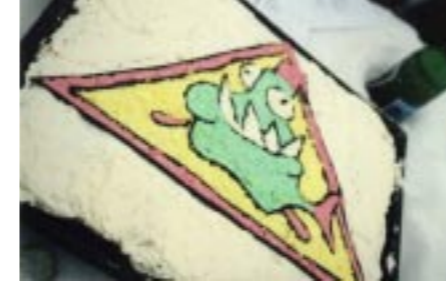
▲ C-brudarna vet hur man bäst mutar ett helt stim pirayor...