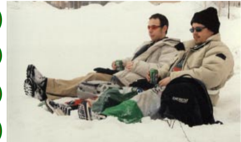
▲ OS gör sig även bra från åskådarplats, om man inte är frusen av sig.