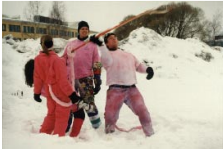
▲ Stilstudie: The Pink and the Beautiful utövar kast med trasig skida, en av de krävande och ärorika OS-grenarna.