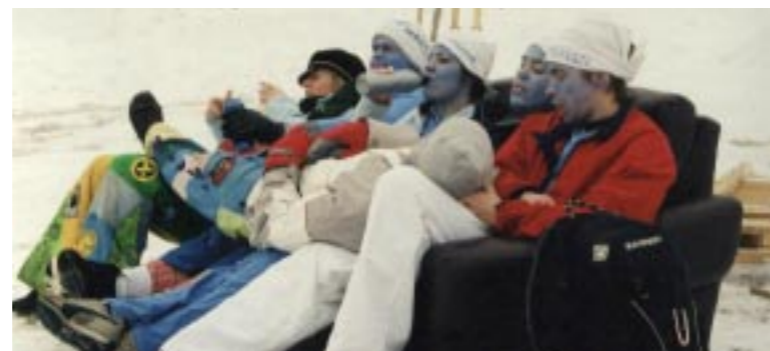
▲ I en nästan alldeles egen soffa satt Super Smurfarna? och drack vad Tsur antog vara sportdryck.