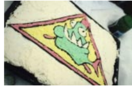
▲ C-brudarna vet hur man bäst mutar ett helt stim pirayor...